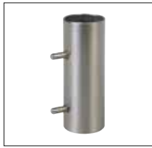
Anwendungsbeispiel Maschinenbau Example of use Machine construction