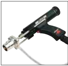
Standardschweißpistole PH-3N PH-3N standard welding gun